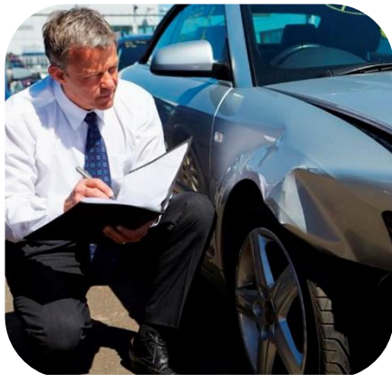
Periti danni auto